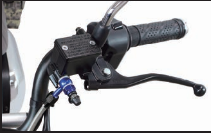
装着写真(ダックス125(JB04))