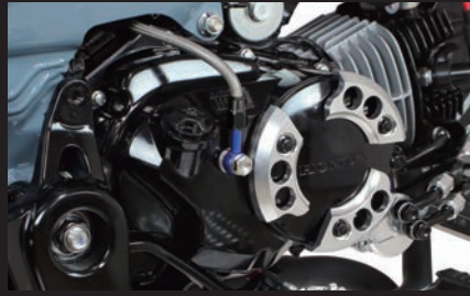
装着写真(ダックス125(JB04))