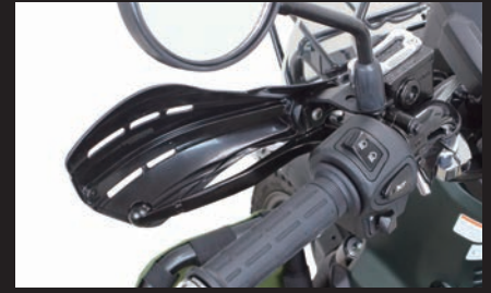
ナックルガード同時装着(クロスカブ110(JA60))