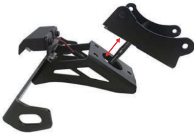
フェンダーレスキット