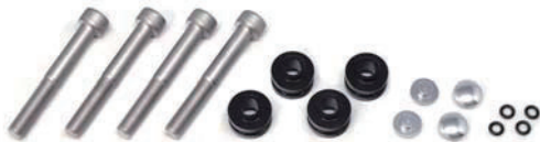
ボルト、カラー各4個入り