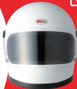
STAR II 税込価格 ¥39,600