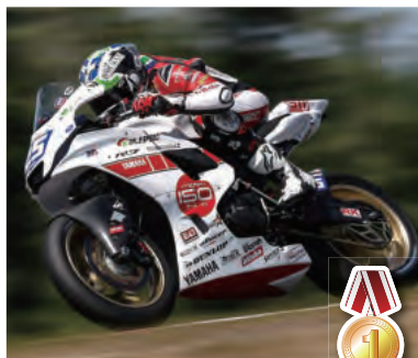
#25 Dominic Doyle選手