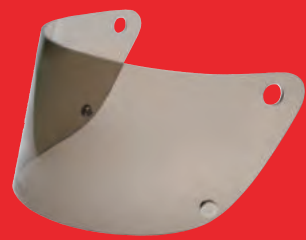
スモークシールド 税込価格 ¥5,280