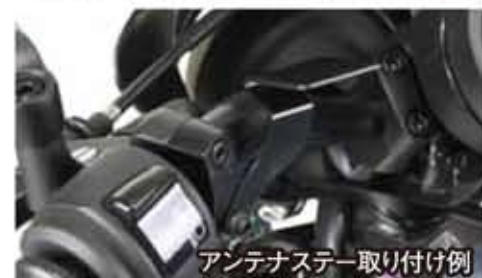
アンテナステー取り付け例