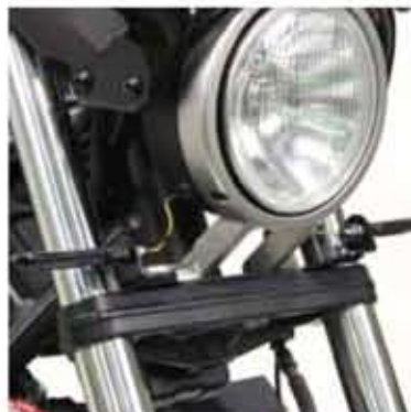
155023 レブル シーケンシャルウインカーキット フェザータイプ