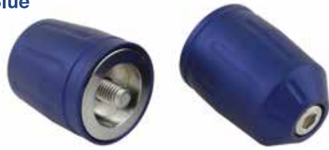
写真は033579-31:KAWASAKI M8 Type