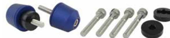
写真は031176-31:HONDA M6 Type