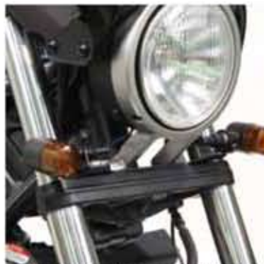
155491-56 レブル クラシカル71ウインカーキット