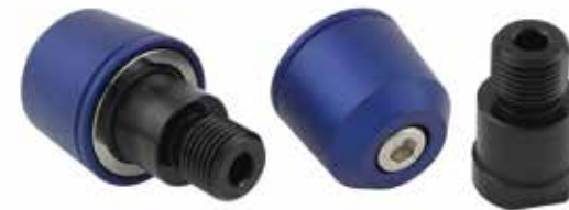
写真は032779-31:YAMAHA M16 Type