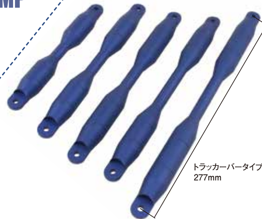
トラッカーバータイプ 277mm

090167-31:.....¥2,200(本体価格¥2,000) JAN:4945716145880