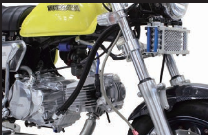
装着写真(4フィン5オイルライン)