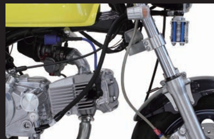
装着写真(3フィン4オイルライン)