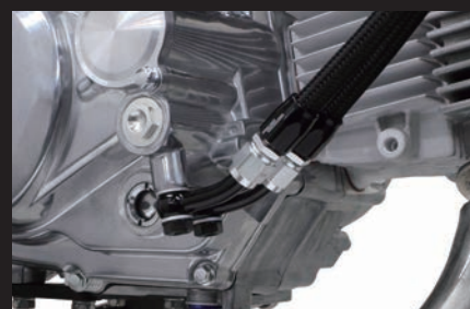
装着写真(オイル取り出し口)