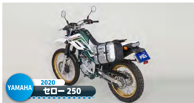
YAMAHA 2020 ゼロ 250