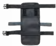
MP-337 イージーベース シングル