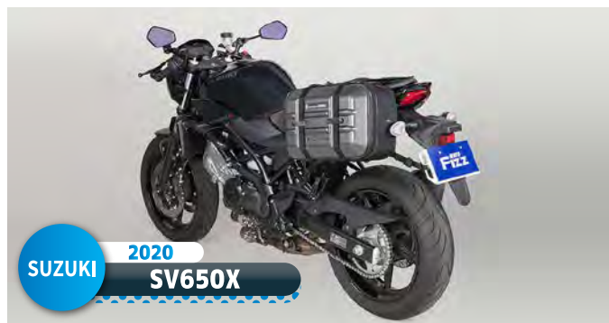
SUZUKI 2020 SV650X