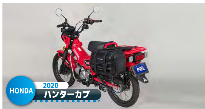
HONDA 2020 ハンターカブ