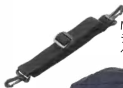
MP-12 ショルダー ベルト