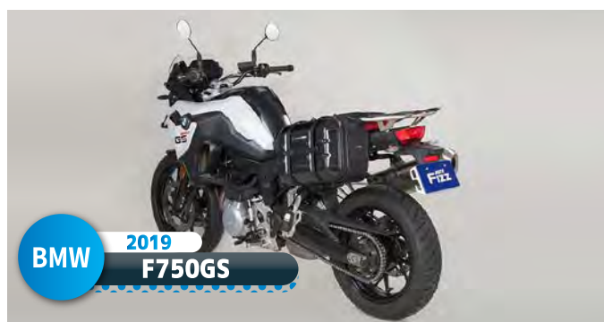
BMW 2019 F750GS